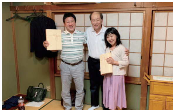
前年度会長幹事慰労会