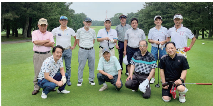
第125回ゴルフ会参加者