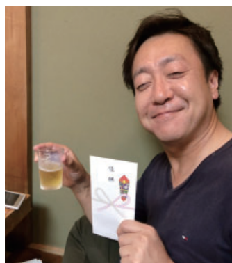
ゴルフ優勝者鯨井会員