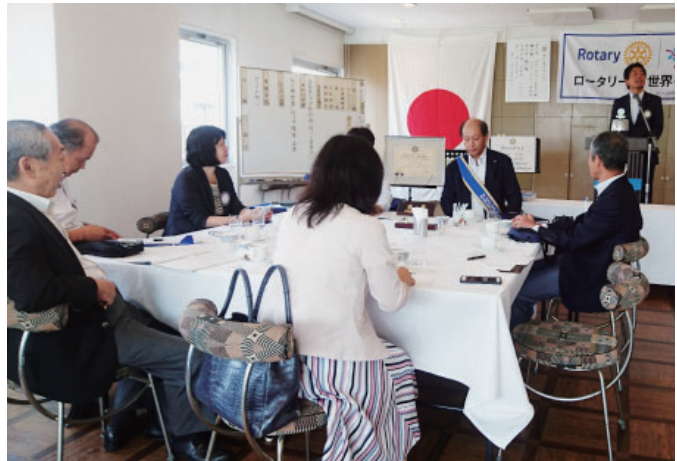
卓話を楽しく拝聴しました